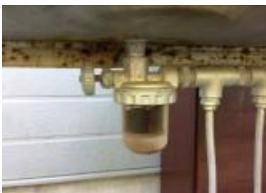
フィルターの汚れ