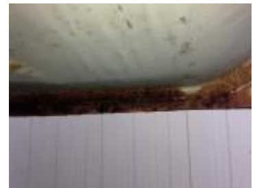
タンク外装のサビ